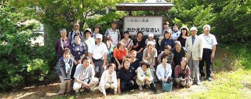
岩内温泉「おかえりなさい」に宿泊、天候にも恵まれました。