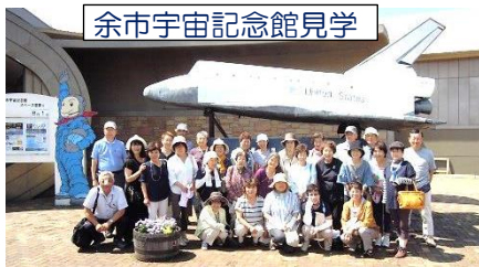
余市宇宙記念館見学