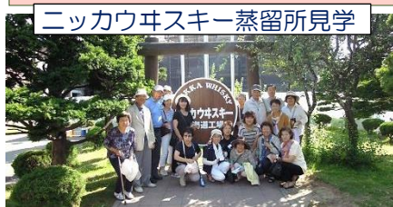
ニッカウスキー蒸留所見学

その三行とは、「核」を鉛筆で塗りつぶせペンで書きあらめよ 岩内での研修も奥が深いですね。作家の水上勉とは...興味が湧いてくるものです。