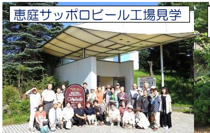
恵庭サッポロビール工場見学