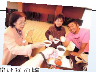
手前は私の腕です！